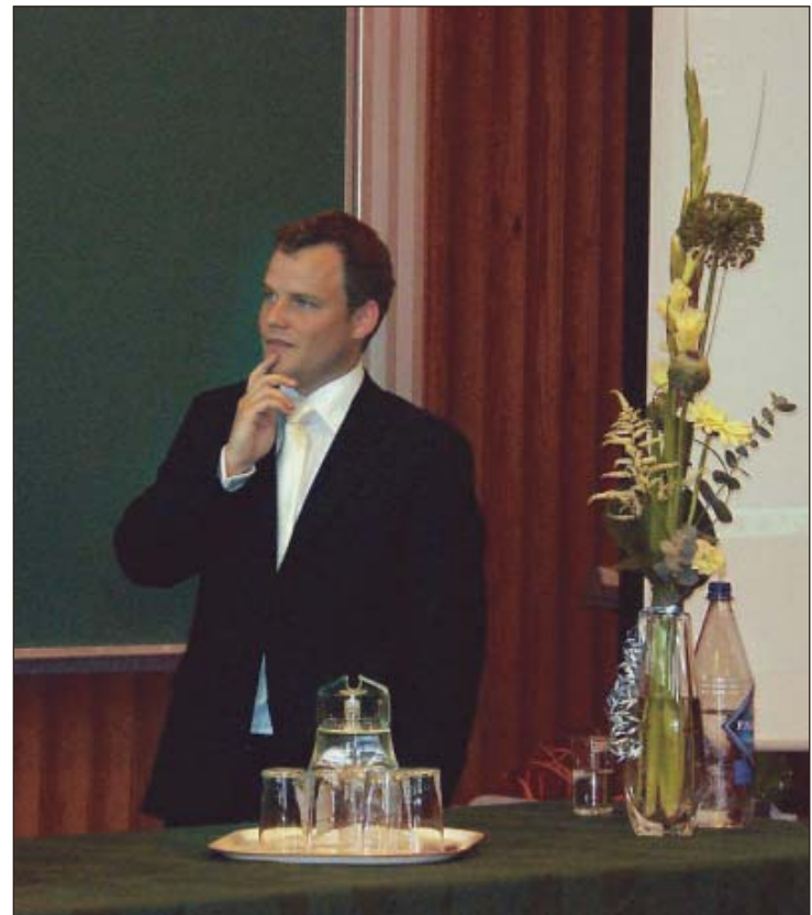
TENKER: Klas var enkelte ganger svært tankefull under disputasen.

selv om dette er unnagjort. Han har sagt ja til tre nye år med forskning på Ås. Det skjer først etter at pappapermisjonen er over.